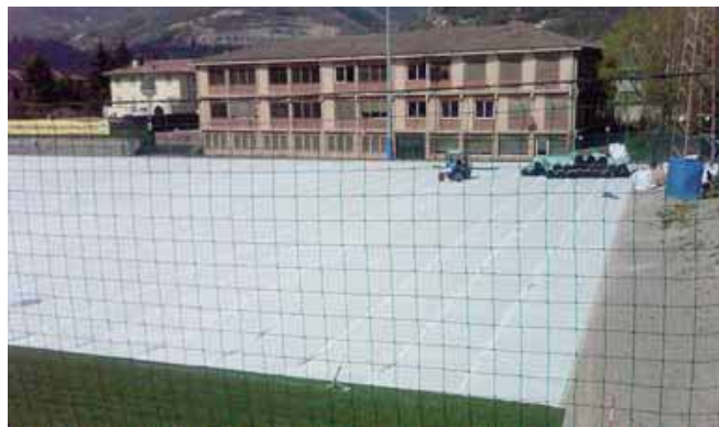
La posa del manto sintetico al campo da calcio